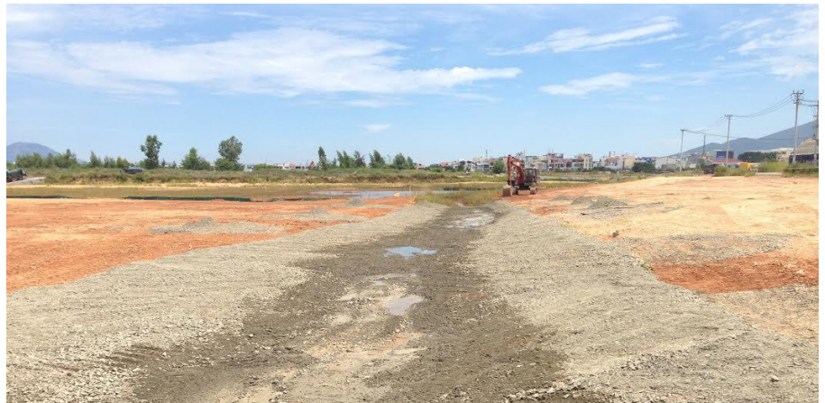
Chuẩn bị khu vực cho mùa mưa với các biện pháp chống xói mòn

Các nhà thầu USAID đã hoàn tất phần lớn hoạt động đào xới Giai đoạn 2 ở Hồ Sen và vùng đất ngập xung quanh ở đầu Bắc khu vực Dự án, nhanh hơn tiến độ dự kiến cho năm 2015. Các khu vực này được bảo vệ trước mùa mưa sắp tới bằng cách thực hiện các biện pháp kiểm soát xói mòn, rải sỏi nghiền sạch trên mặt khu vực bị nhiễm bẩn nhằm ngăn ngừa các chất nhiễm bẩn thoát ra khỏi khu vực.