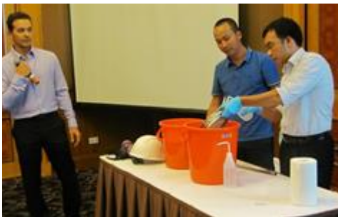
Hands on demonstrations of standard operating procedures for dioxin soil and sediment sampling

USAID held the first of a four-part training program designed for Government of Vietnam stakeholders and counterparts on key aspects of conducting an environmental assessment. Part One was held over a three-day period and was attended by 30 representatives from the Ministry of Defense - Academy of Military Science and Technology, Air Defense Air Force Command Chemical Command, Vietnam-Russia Tropical Center; Dong Nai Department of Natural Resources and Environment; Danang Department of Natural Resources and Environment; Center for Environmental Monitoring under the Ministry of Environment and Natural Resources/Vietnam Environment Administration; and Office 33. The training covered aspects of sampling including standard operating procedures, methodology, and planning. Training activities included classroom lectures, hands-on demonstrations, and practical application through case study exercises.